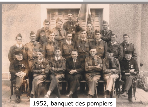
1952, banquet des pompiers